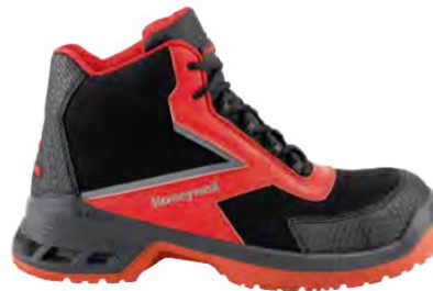
WIN MID S3 HI CI SRC Art.-Nr.: 62 461 68