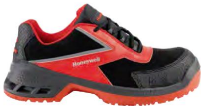
WIN S3 HI CI SRC Art.-Nr.: 62 461 67